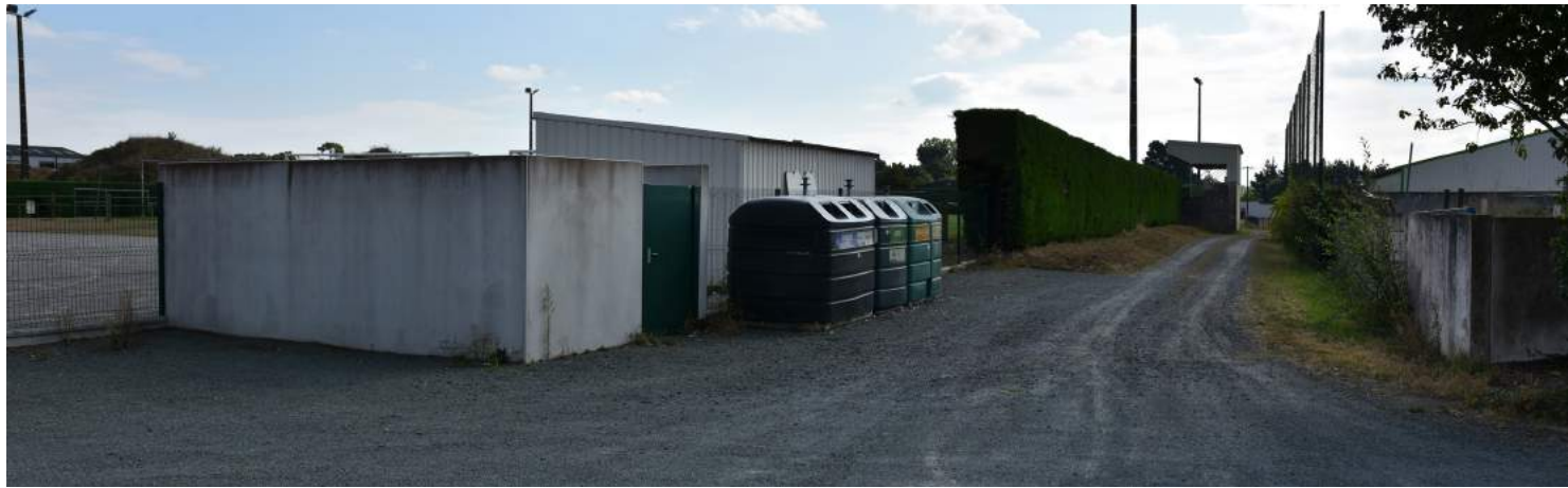
VUE 1 EXISTANT : vue Sud-Ouest depuis le futur parking vers l'entrée principale