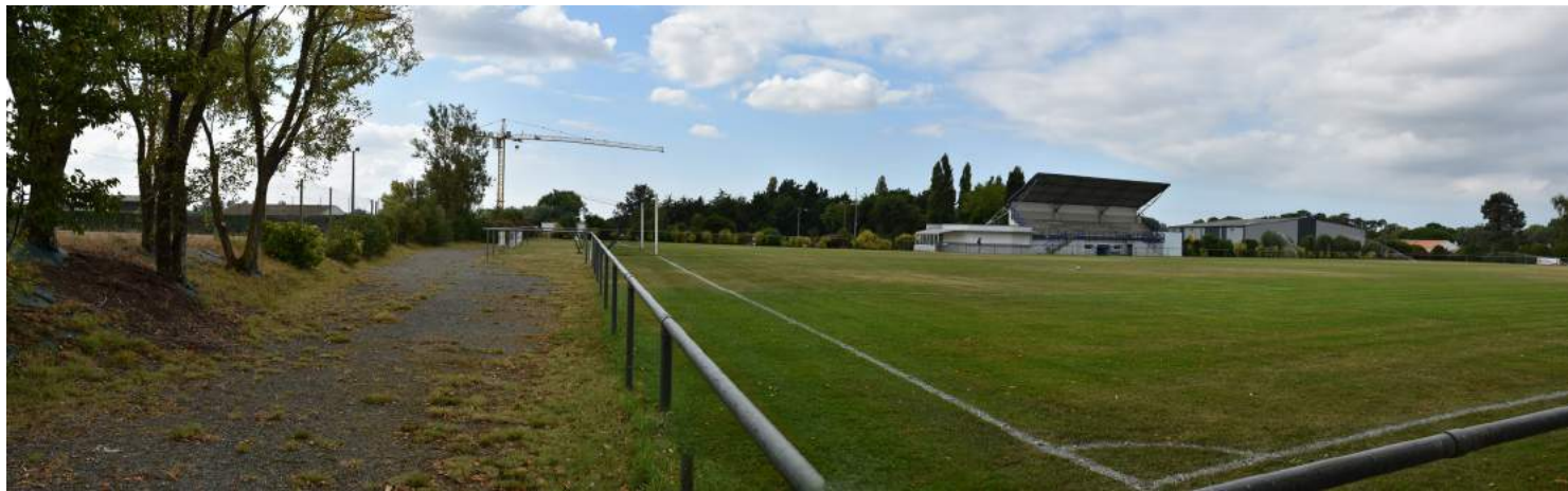
VUE 3 EXISTANT : vue Nord depuis la voie douce