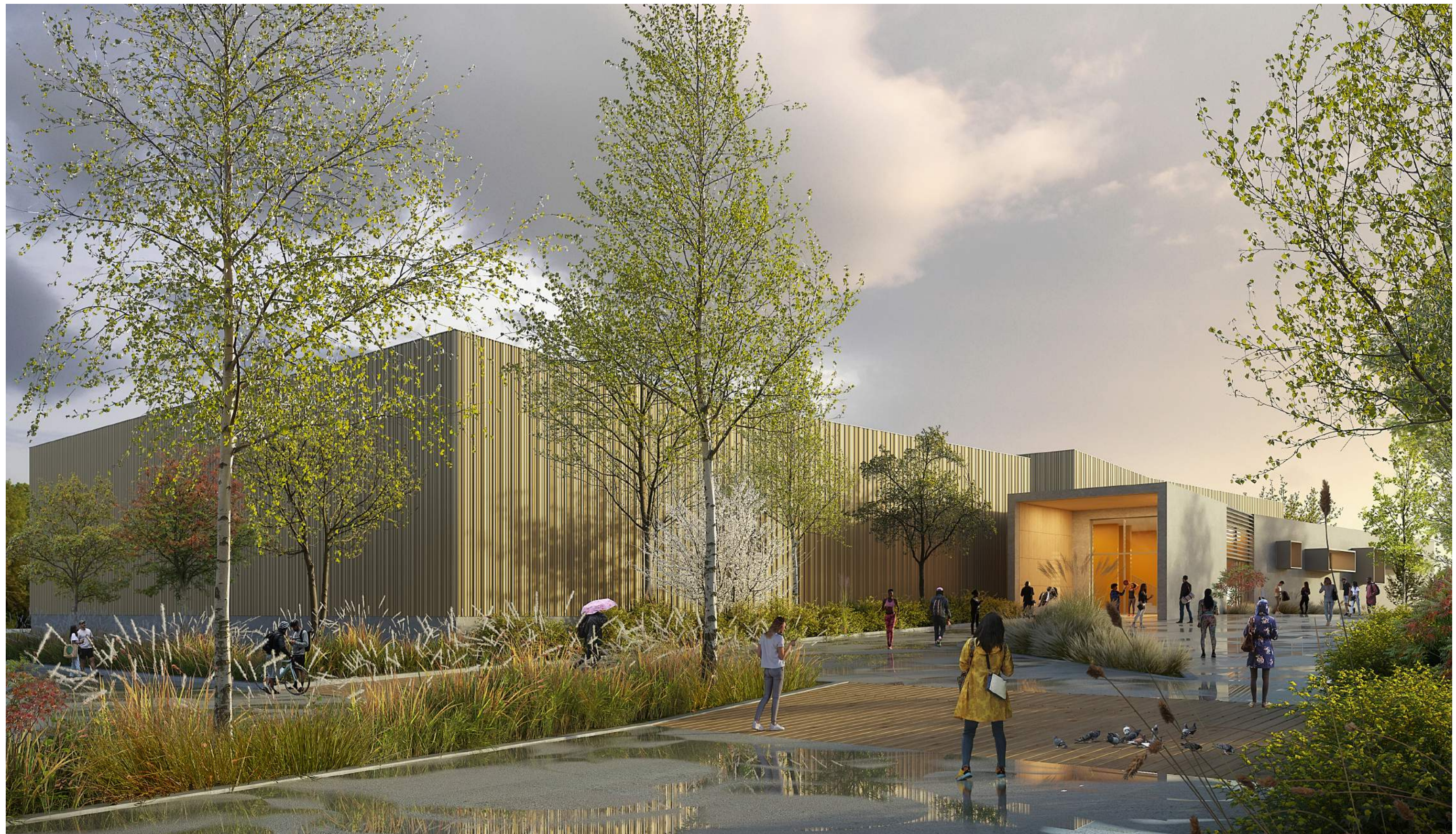
VUE 1 PROJET : vue Sud-Ouest depuis le futur parking vers l'entrée principale

CONSTRUCTION D'UN COMPLEXE SPORTIF COMMUNAL CHEMIN DU STADE 85300 SOULLANS