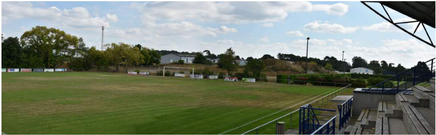
VUE 2 EXISTANT : vue ouest depuis les tribunes