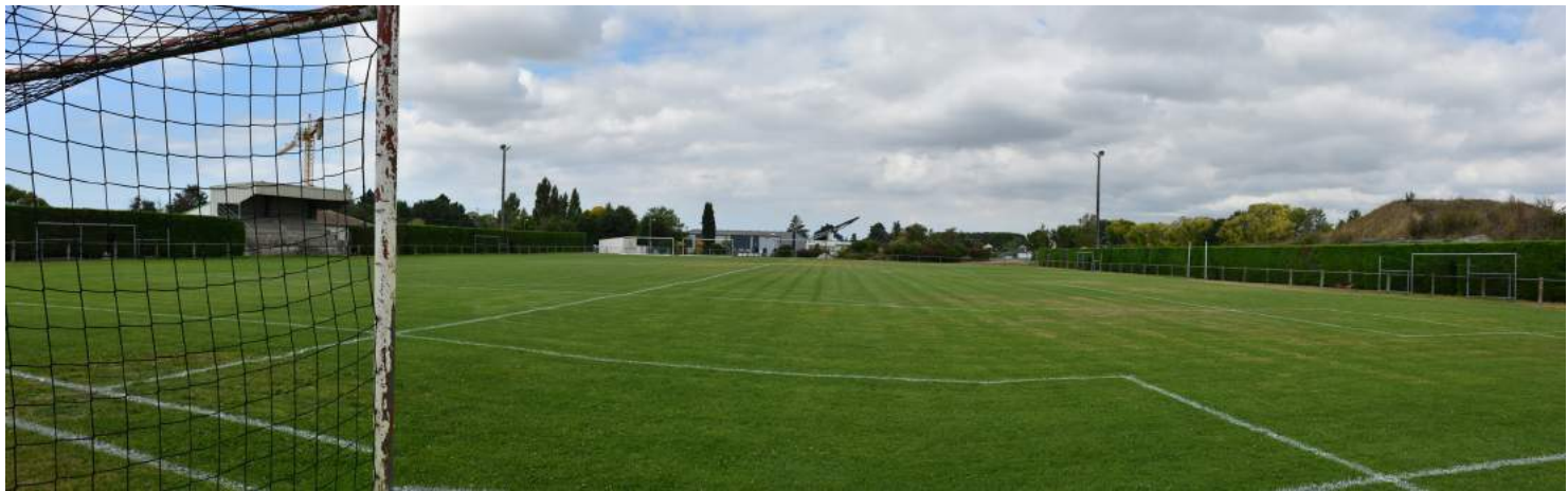
VUE 4 EXISTANT : vue Est depuis le terrain existant