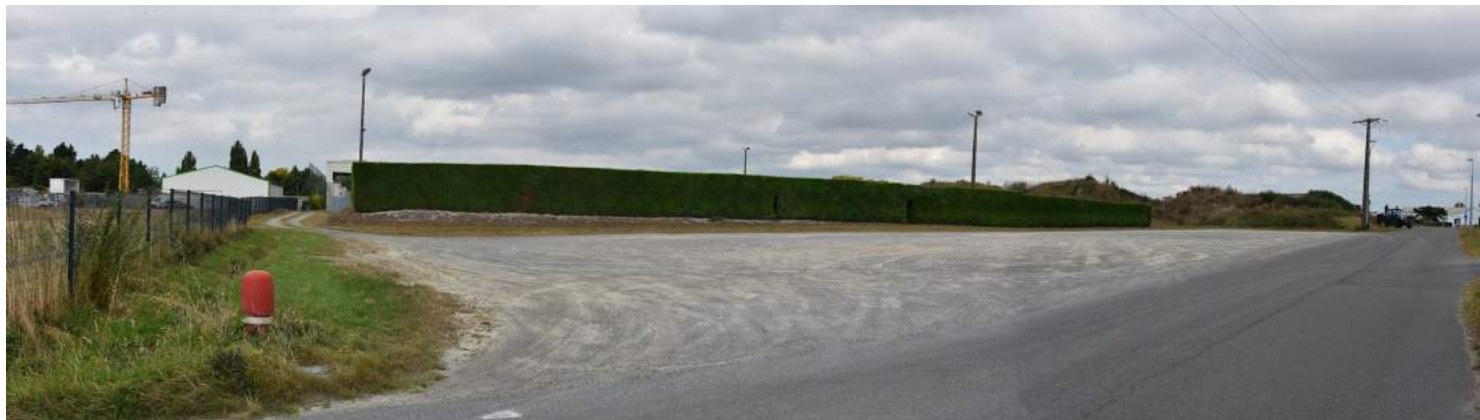
VUE 5 EXISTANT : vue Nord depuis la rue des Frênes

CONSTRUCTION D'UN COMPLEXE SPORTIF COMMUNAL CHEMIN DU STADE 85300 SOULLANS